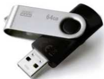
Une clé USB (Indispensable)

L'AUTRE VIENT AVEC VOUS EN COURS contient la séquence traitée et le dossier cours/exercices