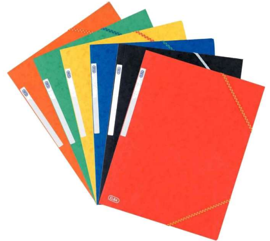
2 pochettes à rabats

L'UNE PEUT RESTER A LA MAISON pour ranger les séquences déjà traitées