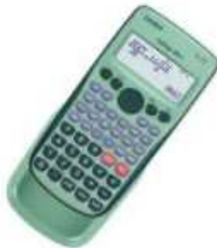
Une calculatrice scientifique (Déjà en math !)