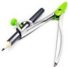
Un compas (Déjà en math !)