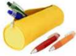
Trousse avec stylo bille, etc.