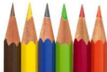
Crayons de couleur (5 ou 6 minimum) et un taille-crayon