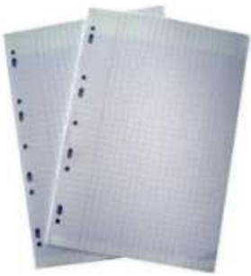
Des copies simples ou doubles (petits carreaux de préférence)